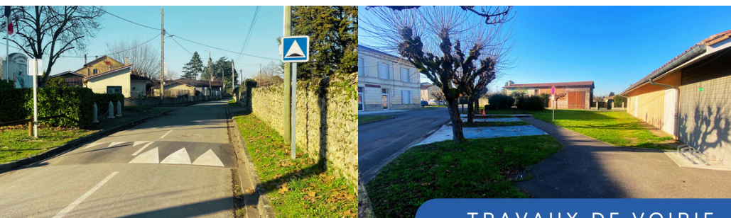
TRAVAUX DE VOIRIE

J'en profite également pour vous renouveler mes meilleurs vœux pour 2025, à vous ainsi qu'à vos proches. En 2025, nous continuerons à travailler pour vous, en mettant tout en œuvre pour faire de notre commune un village encore plus agréable à vivre !