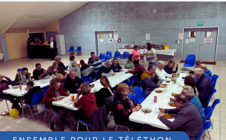
ENSEMBLE POUR LE TÉLÉTHON